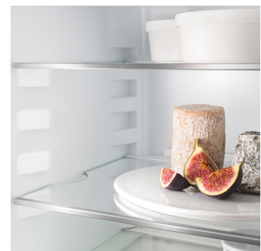
Komfort-Höhenverstellung für Glasplatten

Die LED-Deckenbeleuchtung beleuchtet den Innenraum von oben - für eine gute Übersicht Ihrer Lebensmittel. Der Extra-Lichtblick: Die LEDs sind vor den Glasplatten positioniert, sodass auch ein voller Kühlschrank gut beleuchtet wird.